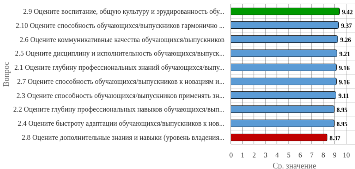
Рисунок 1.2 - Распределение показателей уровня удовлетворенности респондентов по блоку вопросов «Удовлетворенность качеством подготовки выпускников»

Индекс удовлетворенности по блоку вопросов «Удовлетворенность качеством подготовки выпускников» равен 9.09.